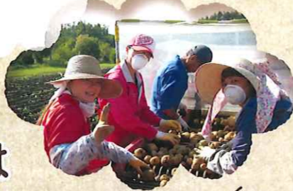
トラクターに乗って...