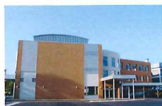
しゃきっとプラザ

オホーツク海沿岸と北見内陸地帯の中間に位置し、オホーツク海流・海霧・流水の影響を受けやすく、夏には一時高温を記録するものの年間を通すと冷涼な気候で、降水量も道内では最も少なく、日照時間の長さは国内有数の地域。