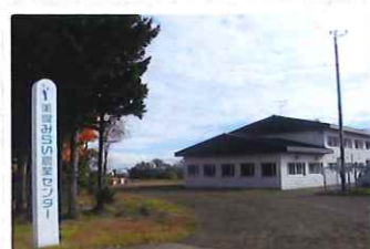
美幌みらい農業センター