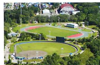
柏ヶ丘陸上競技場・野球場