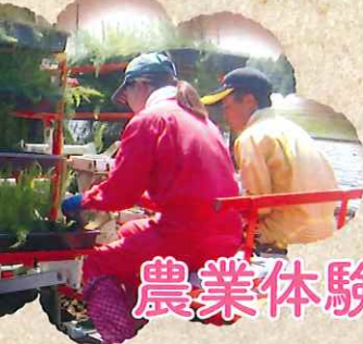
アスパラの苗植え

美幌みらい農業センターは 「農業を気軽に学んで体験したい！」 そんな女性を応援します。