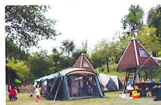
みどりの村森林公園キャンプ場