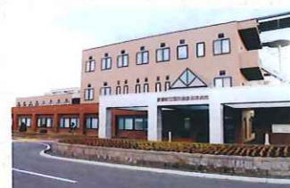
美幌町立国民健康保険病院