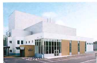
美幌町民会館「びほーる」