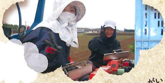
じゃがいもの収穫