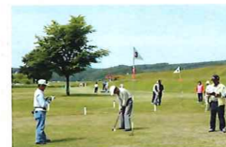
河畔公園パークゴルフ場