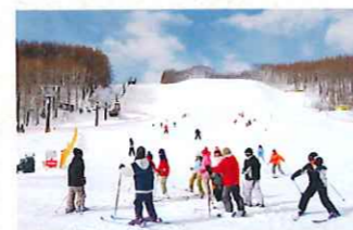
リリー山スキー場