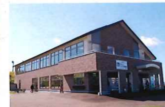
道の駅ぐるっとパノラマ美幌峠