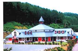
グリーンビレッジ美幌